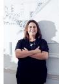
Maja Hoffmann Présidente, Fondation Luma