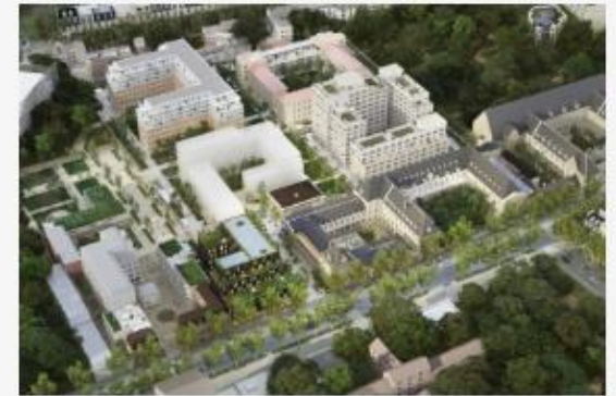
Façade Denfert © lotsoarch&lab

Thanks for Nothing, lauréat de la consultation de la Ville de Paris pour la Façade Denfert à Saint-Vincent-de-Paul