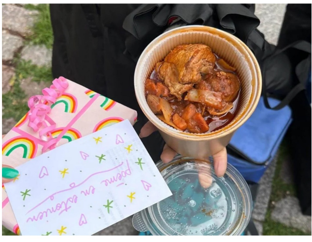
Thanks For Nothing, FOOD & POEMS, les maraudes citoyennes, alimentaires et culturelles, Poème et repas chaud, 2024 ⓘ