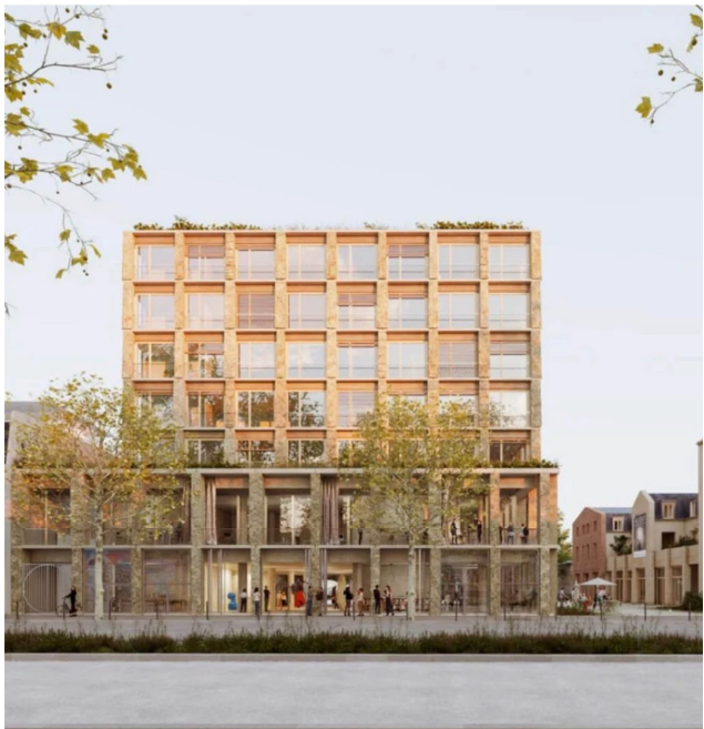
La Collective : bâtiment Denfert depuis l'avenue Denfert Rochereau à Paris ⓘ

Le projet le plus ambitieux reste à venir. En 2028, Thanks for Nothing ouvrira La Collective , 3 500 m² dédiés à l'art et à la solidarité dans l'ancien hôpital Saint-Vincent-de-Paul. Ce centre d'art d'un nouveau genre sera doté d'espaces d'exposition, d'un auditorium, d'ateliers pour des artistes, mais aussi d'un accueil de longue durée pour femmes victimes de violences et familles sans abri, en partenariat avec Emmaüs Solidarité . « Ce n'est pas la même chose d'entrer par deux portes différentes, souligne la directrice de Thanks for Nothing. Il y aura une grande porosité entre tous les espaces. »