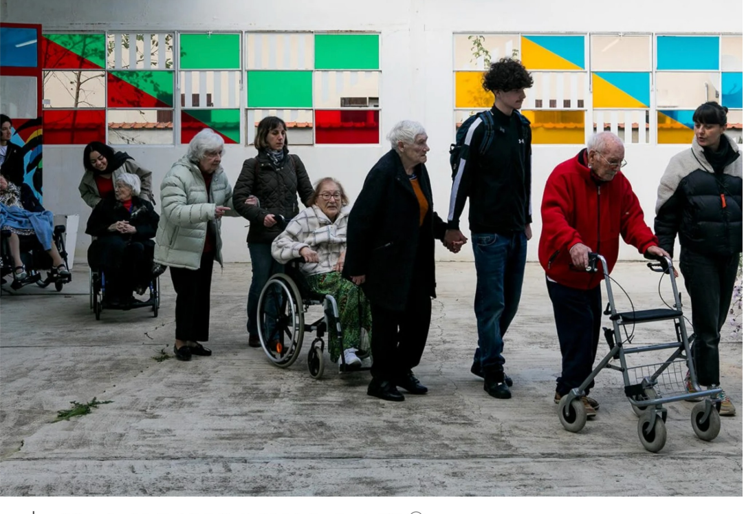
Visite dans les galeries, Thanks For Nothing à La Galleria Continua, Novembre 2024 ⓘ

Des repas chauds, des livres d'art et des poèmes déclamés dans la rue ; mais aussi une multitude de projets artistiques et de visites dans les galeries avec des réfugiés et des personnes exclues. Pour le dernier épisode de notre série consacrée aux associations, nous avons rencontré Thanks for Nothing, un collectif qui bouscule les codes de la solidarité en plaçant la culture au cœur de l'urgence sociale.